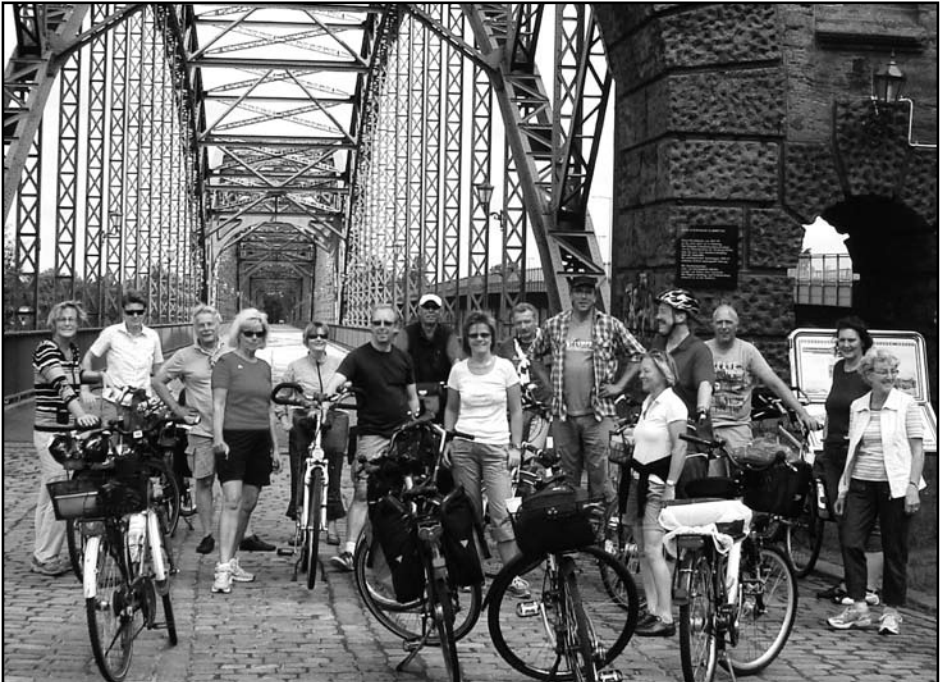
Auf der alten Süderelbbrücke

Von der alten Harburger Elbbrücke ging es zur BallinStadt. Mittagspause und Picknick auf der grünen Wiese. Erstaunlich wenig los dort für einen Sonntag, aber vielleicht ändert sich das mit IBA und Gartenausstellung. Inzwischen zeigte sich die Sonne von Ihrer besten Seite und ein jeder ließ es sich schmecken und nutzte die Rast zur Erholung.