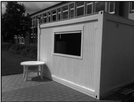
Da ist er also.