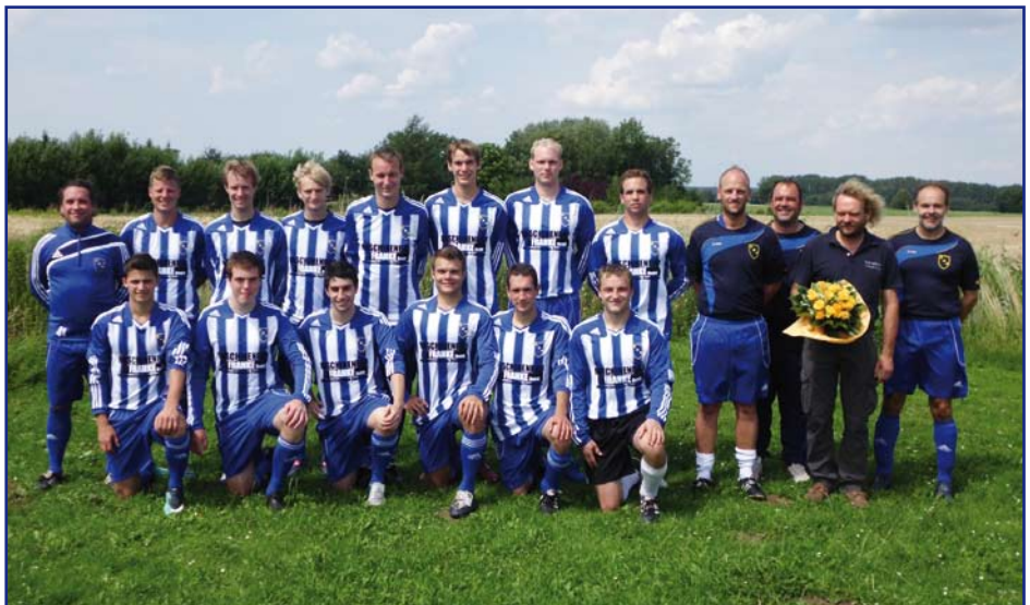
Neuer Trikotsponsor für die 2. Herren